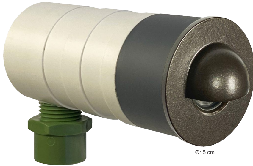
← Conector PVC Incluido