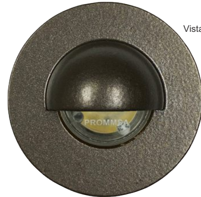
Vista Frontal Caratula

Uso: Exteriores / Interiores, NO SUMERGIBLE. Protección: IP-64 Instalación: Empotrar en muro (Carcasa PVC). Material: Fundición de Al. Difusor: Cristal templado. Tornillería: Acero Inox. Empaque: Silicón vulcanizado. Acabado: Pintura electrostática (Polyester). Color: Bronce Viejo. Lámparas: 1 LED de 3 W. Ópticas: Asimétrica. Driver: Integrado Temp. color: 2200°K CRI: 80. Voltaje: 120 VCA